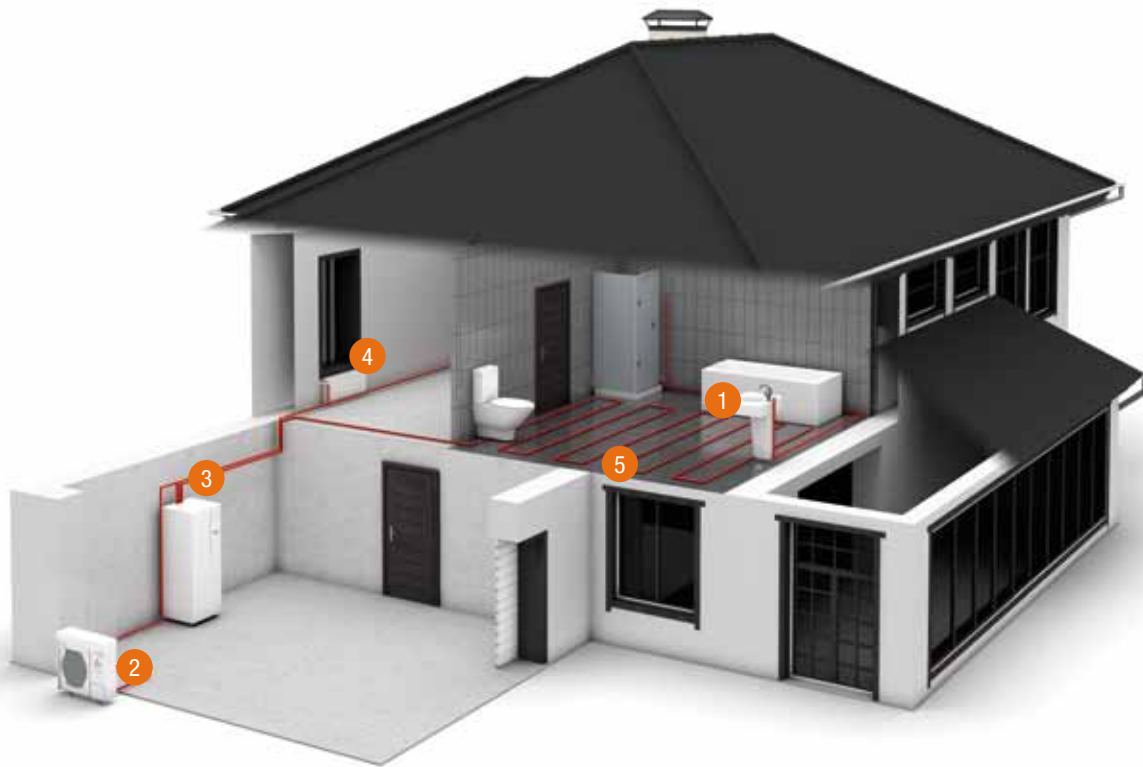
1 Sanitair warm water, 2 Buitenunit warmtepomp, 3 Ecodan boiler of voorraadvat, 4 Radiator, 5 Vloerverwarming